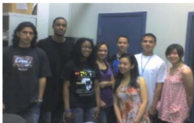
Middle College Seniors