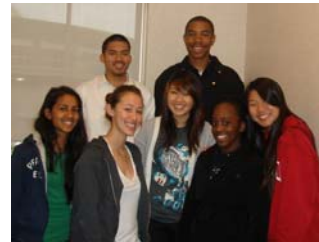
El Cerrito High Seniors