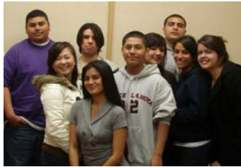
Richmond High Seniors

While most of our students have been in state testing during the last two weeks in April, our seniors were not. So I took this opportunity to meet with representative seniors from seven of our high schools to ask them who made a difference for them as they went through school. Their stories reaffirm what we know from research – teachers are much more