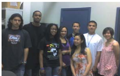
Middle College Seniors