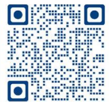
Powerschool para padres