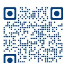
Parent Powerschool account