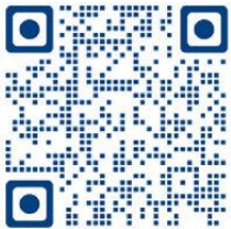
Annual School Forms