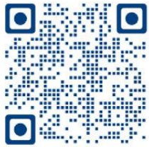
Educational Benefits Form