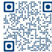
Formularios Escolares Anuales